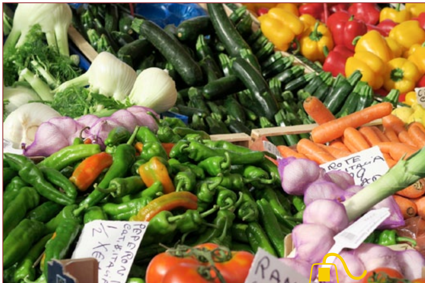
Canon PowerShot G7 X - zoom 4.2x equivalente a 24-100mm su focale 100mm 1/640 f/4, 125 ISO