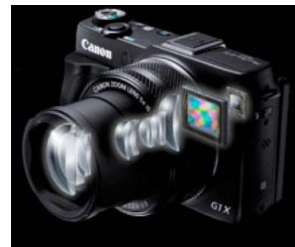
Foto a sinistra: Sensore da 1.5", processore Digic 6 e obiettivo: sono tutti componenti sviluppati da Canon, che interagiscono tra loro per garantire la massima qualità d'immagine in tutte le situazioni

ascoltare con attenzione le richieste dei fotografi e degli appassionati più esigenti. Quelli che cercano una compatta da abbinare alla propria reflex. Un secondo corpo macchina in grado di fronteggiare le situazioni di ripresa più complesse. Dalla macro, appunto, ora a soli 5cm, alla velocità e precisione del sistema autofocus, all'ottica di alto livello, allo stesso tempo retrattile per mantenere ridotte le dimensioni della fotocamera. Questo ha determinato