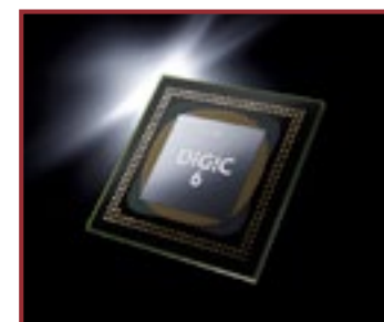
Il potente processore Digic 6 e il sensore Cmos da 12 Mega, sono il cuore della PowerShot G16 che vanta diverse migliorie tecnologiche

immagini con una più estesa gamma dinamica, una sensibilità fino a 12.800 ISO e un buon dettaglio d'immagine anche nelle condizioni di ripresa in luce scarsa. La velocità di calcolo del processore ha consentito di portare la cadenza di ripresa a 12 fotogrammi per secondo e di aumentare del 41% la velocità dell'autofocus.