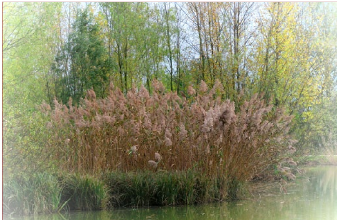
Canon PowerShot G7 X - zoom 4.2x equivalente a 24-100mm su focale 100mm 1/1250 f/3.5, 200 ISO - Effetti creativi on-camera