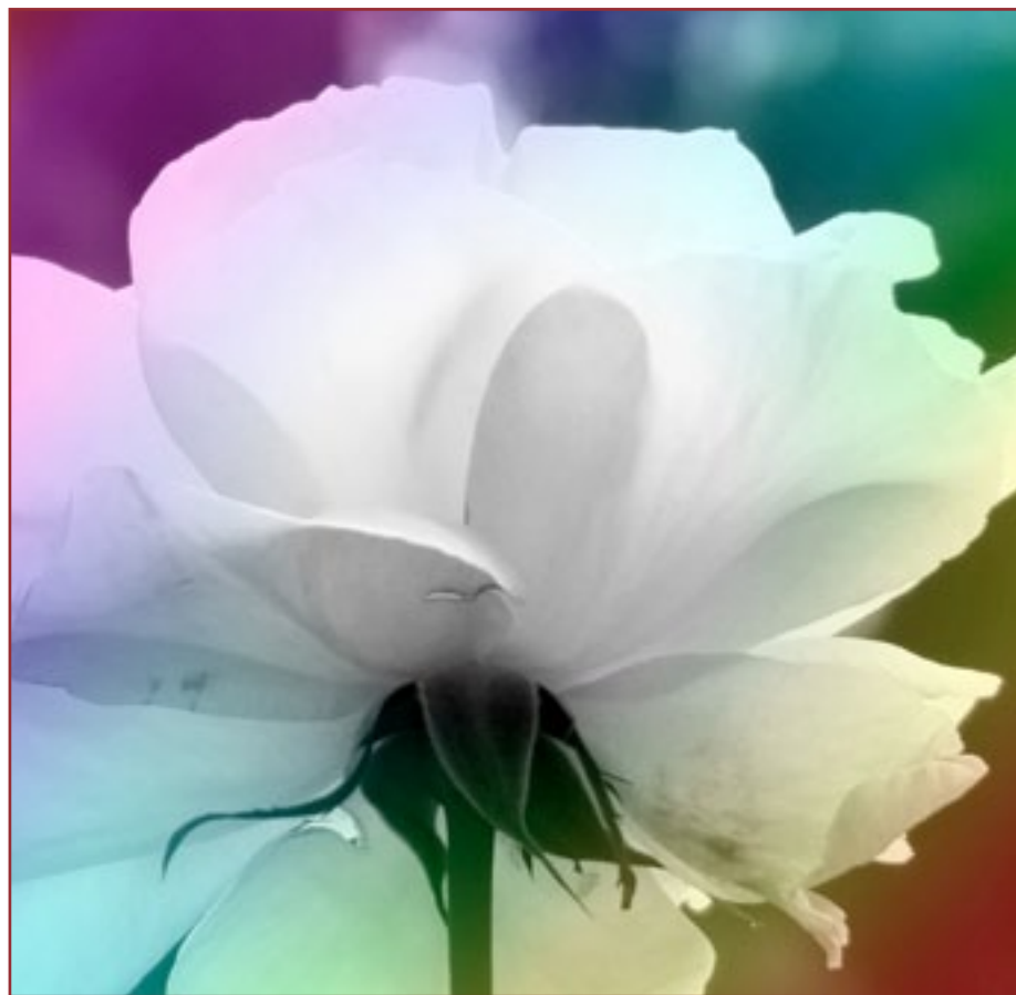
Canon PowerShot G7 X - zoom 4.2x equivalente a 24-100mm su focale 100mm - 1/500 f/2,8, 200 ISO - Effetti Creativi on-camera

Sensore: Cmos 1/2,3" retroilluminato Pixel effettivi: 16,1 Mega Processore: Digic 6 Obiettivo: zoom 65x, 3,8-247mm (equiv. 21-1365mm) Apertura: f/3,4-f/6,5 Stabilizzazione: ottica IS, 3,5 stop Messa a fuoco: AiAF, punto centrale spostabile, Face Detection Modalità AF: singolo, continuo, servo AF/AE, AF tracking Esposizione: Valutativa, media pesata al centro, spot (centrale, Face Detection e FlexiZone AF) Programmi: P,Tv, Av, M, C1, C2 Auto, SCN Sensibilità ISO: 100-3.200 Otturatore: 15sec-1/2000 sec Sequenze: 6.4fps Display: TFT 3", 922.000 pixel Mirino: Sì Flash integrato: Sì Effetti: Sì, anche video Formato file: Jpeg, Raw, Mov Video: Full HD 60/30fps, iFrame Microfono: integrato Interfaccia: USB, uscita A/V, mini HDMI WiFi: Sì GPS: No Dimensioni: 127,6x92,6x114,3mm Peso: 650gr (con scheda e batteria) Varie: Hdr, Zoom Framing Assist