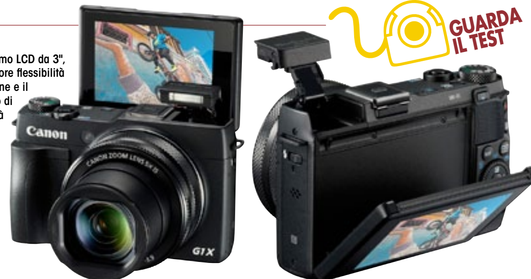
Foto sotto: La personalizzazione è uno dei punti di forza della G1 X Mark II. Sul barilotto dell'obiettivo ci sono ben 2 ghiera personalizzabili. Una ha un movimento fluido e continuo, ideale per la messa a fuoco di precisione, l'altra, a step, ad esempio per selezionare tempi di scatto, diaframma e via dicendo

Sul retro spicca l'ampio schermo LCD da 3", touch e inclinabile per una maggiore flessibilità nell'inquadratura. L'alta risoluzione e il profilo colore sRGB permettono di avere una visione di elevata qualità