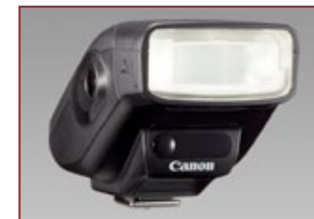
La G16 può utilizzare tutti i flash dedicati Canon. Dal compatto Speedlite 270EX II al più performante Speedlite 580EX II

Anche la costruzione del corpo macchina è particolarmente curata. Il corpo è realizzato in pressofusione di alluminio per coniugare robustezza e leggerezza. La PowerShot G16, infatti, è pensata per il professionista che ha bisogno di un apparecchio poco appariscente, magari da affiancare alla reflex, che gli consenta di affrontare qualunque situazione, anche la più dura. La maneggevolezza dell'apparecchio è quella, già sperimentata, della precedente G15. I comandi, ghiera per lo più, sono tutti a portata di dito, azionabili senza togliere l'occhio dal mirino ottico, di cui è dotata. Oltre, naturalmente, all'oramai consueto display LCD. Tra le soluzioni che aumentano la maneggevolezza dell'apparecchio va citato, infine, il nuovo sistema di stabilizzazione. Si tratta di una stabilizzazione ottica, sistema di cui Canon ha profonda esperienza. Denominato Intelligent IS, una volta attivato, automaticamente effettua la correzione del mosso e sceglie fra sette variabili preimpostate nella memoria dell'apparecchio. Assieme all'Intelligent IS opera